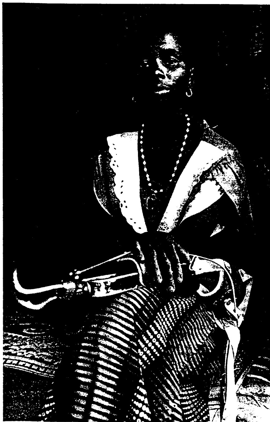
Sierra Leone : cette femme de trente-huit ans a eu le bras coupé par des rebelles qui ont attaqué sa ferme en 1997.

Document 2 : photo extraite de Ces femmes que l'on détruit , les éditions francophones d'Amnesty international, 2000 ; page 56