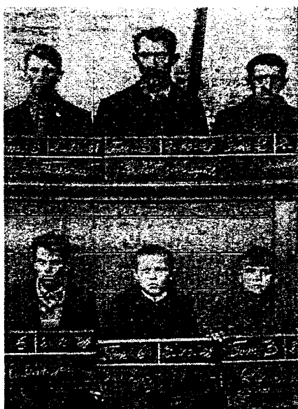
Photographie d'embauche dans les années 1920 dans les mines (centre historique minier du Nord-Pas de Calais à LEWARD)